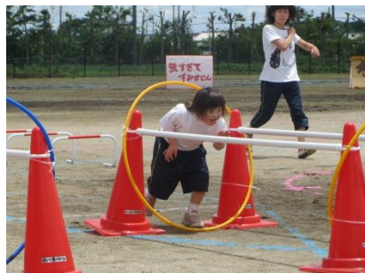
〈小低〉 はばたきランドの 魔法使い