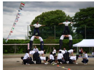
〈高等部〉 のんちゃんこ体操 & 組体操