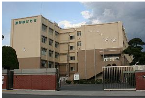
深谷はばたき特別支援学校

地域の小学校・中学校に在籍する児童生徒が、特別支援学校の専門的な指導(自立活動)を受けるために、深谷はばたき特別支援学校に来て、個別で学習をします。